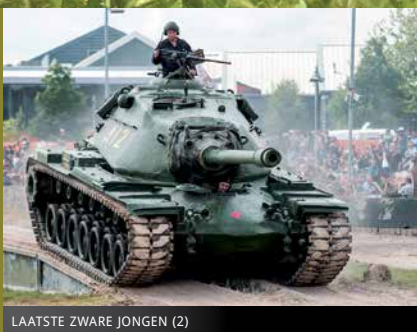
LAATSTE ZWARE JONGEN (2)