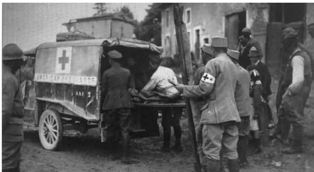
De evacuatie van een gewonde door een Amerikaanse ambulance. 15 juli 1916, bij Recourt-le-Creux in het gebied Meuse.

aan het front bij Verdun kwam redden. Hoewel de Verenigde Staten op dat moment nog niet aan de zijde van de Geallieerden aan de oorlog deelnamen, verleende een handjevol Amerikanen al wel hulp aan Frankrijk. Vanaf september 1914 werd het Amerikaanse ziekenhuis in Neuilly gemobiliseerd om de gewonden aan het front te verzorgen. Tegelijkertijd vertrokken enkele honderden jonge vrijwilligers, voor het merendeel afkomstig van de Ivy League (de grote particuliere universiteiten in het noordoosten van de Verenigde Staten) naar Europa. “Sommigen wilden waarschijnlijk ‘de beschaving redden van de barbaren’, anderen hadden oude familiebanden met Frankrijk en Engeland, maar de meesten waren vooral op zoek naar een beetje spanning en avontuur”, zegt Ross Collins, hoogleraar aan de Dakota State University en expert op het gebied van de Eerste Wereldoorlog.